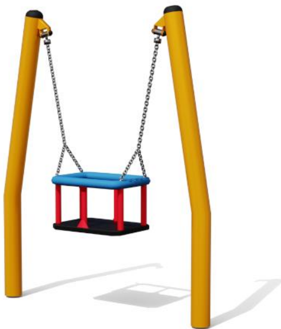
Wersja 2245A z siedziskiem kubekowym

Nawierzchnia amortyzująca powinna być wykonana na całej powierzchni zderzenia.